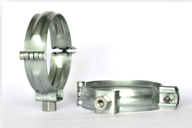
M6 Mutter mit mind. 4 tragfähigen Gewindegängen